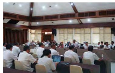
14 Maret 2023 | March 14, 2023

On March 14, 2023, PTPN VIII organized an In-House Training event “Leaders Culture Exploration” at the Multipurpose Room. The purpose of this event is to enhance the competencies of employees, particularly for the Agro Group Reinforce Internalization of Culture (AGRIC) team at PTPN VIII, in the field of Corporate Culture. A total of 100 employees from PTPN VIII participated in the event. Through this training, employees are expected to better internalize the cultural values of the company and apply them in their daily activities.