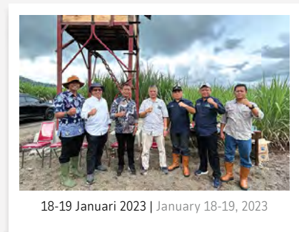
18-19 Januari 2023 | January 18-19, 2023

PTPN I Regional 4 menerima kunjungan kerja dari Direktur Produksi dan Pengembangan Holding Perkebunan Nusantara III (Persero) pada hari Kamis dan Jumat, 18-19 Januari 2023.