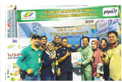
7 Januari 2023 | January 7, 2023

Cinta Manis Sugar Mill (PG CIMA) from PTPN VIII promoted the NUSAKITA sugar brand at the 2023 Ogan Ilir Expo, held as part of the Car Free Day (CFD) event at Taman Ogan Baru, Indralaya, Ogan Ilir, South Sumatra, on January 7, 2023. At the Cinta Manis exhibition booth, they offered 1 kg packaged NUSAKITA sugar as well as Pagaram Tea produced by the Pagaram Tea Mill. The goal of this promotion was to increase brand awareness and expand the market.