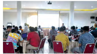
28 Desember 2023 | December 28, 2023

Surabaya (28/12) – PTPN I Region 5 held a workshop on ISO 19011:2018 Management System Audit in the Region 5 Hall. This workshop aims to prepare internal management system auditors before implementing the ISO 19011:2018 management system audit.