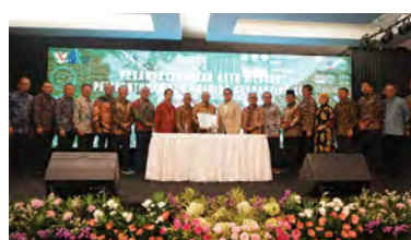
1 Desember 2023 | December 1, 2023

On December 1, 2023, at PTPN III, the inauguration of the establishment of PTPN IV and PTPN I Sub-Holdings, resulting from the merger of 13 companies, was held. The event was attended by