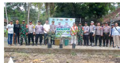
22 November 2023 | November 22, 2023

The Ten Million Trees Planting Program with the Police (Polri) was held simultaneously throughout Indonesia. This initiative is aimed at preserving the environment from global warming, which has become a real and imminent threat that needs to be collectively addressed.