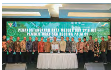
1 Desember 2023 | December 1, 2023

The signing of the Merger and Spin-Off Deeds for the establishment of PTPN IV Sub-Holding took place on December 1, 2023, at the PTPN III office. The consolidation of 13 companies under the auspices of PTPN III, which then split into two Sub-Holdings, namely PTPN IV and PTPN I, was also officially announced during the aforementioned event. The formation of both Sub-Holdings is expected to create synergy among the involved companies and enhance shareholder value and stakeholder interests.