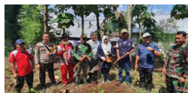
16 Desember 2023 | December 16, 2023

Jember (16/12) – PTPN I Regional 5 Kebun Zeelandia bersama Muspika Tanggul, BPBD, tokoh masyarakat dan tokoh agama beserta masyarakat sekitar menggelar program reboisasi di Kebun Zeelandia.