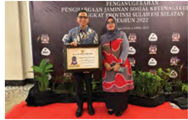
6 April 2023 | April 6, 2023

On April 6, 2023, at the Four Points Hotel Makassar, PTPN XIV, together with Bank Sulselbar, PT Semen Tonasa, the Makassar City Government, the Parepare City Government, and the Enrekang Regency Government, received the South Sulawesi Province Social Security Award from Social Security Agency for Employment. This award is a recognition of the joint commitment and contribution of these entities in providing social security to workers in the South Sulawesi region.