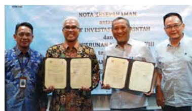
26 July 2023 | July 26, 2023

The signing of a Memorandum of Understanding (MoU) between the Ultra Micro Financing Program (PIP) and PTPN VIII took place on July 26, 2023, at the Government Investment Center in Jakarta. The purpose of this MoU is to create synergy between the Ultra Micro Financing Program and the Empowerment Partnership for Plantation Business Actors. This collaboration is expected to provide significant benefits for plantation business actors. Additionally, the synergy between PIP and PTPN VIII is aimed at strengthening the plantation sector as a whole and supporting economic growth in related regions.