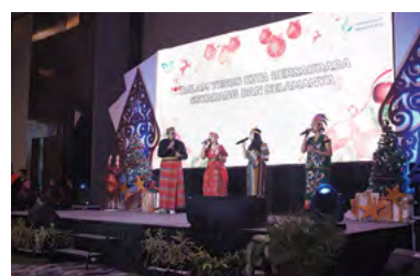
25 Januari 2023 | January 25, 2023

The worship service and joyful Christmas celebration were filled with a sense of solemnity, attended by employees and retirees from PTPN I Regional 4 (formerly PTPN X and PTPN XI), PTPN I Regional 5 (formerly PTPN XII), and PT Sinergi Gula Nusantara.