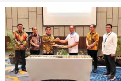
28 Maret 2023 | March 28, 2023

PTPN VII in Bengkulu signed a Memorandum of Understanding (MoU) with the High Prosecutor's Office of Bengkulu on March 28, 2023. This agreement aims to strengthen synergy in handling civil law and state administration issues faced by the Company. Under this collaboration, the High Prosecutor's Office of Bengkulu will provide legal assistance, including legal advice and support in audits.