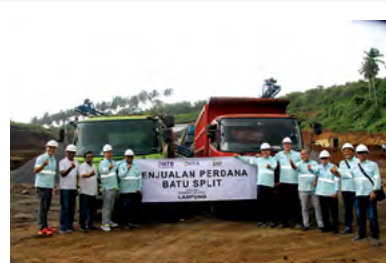
8 Juli 2023 | July 8, 2023

PT Optina Nusa Tujuh (ONT), a subsidiary of PTPN VII, together with PT Halo Tambang Berjaya (HTB), commenced the stone grinding process from the mining area of PTPN VII Unit Bergen Afdeling Kalianda on Saturday, July 8, 2023. Using a crusher machine with a grinding capacity of 250 tons/hour, they aim to produce up to 100 thousand tons per month. This marks a strategic move for the Company in increasing production output and expanding its market share in the stone grinding industry.