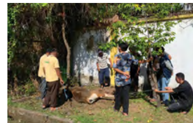
29 Juni 2023 | June 29, 2023

On June 29, 2023, at the Al Baasithu Mosque in the PTPN XIV Board of Directors' Office, a Joint Sacrifice (Kurban Bersama) event was held, attended by all employees. The event was organized by the Al Baasithu Mosque Management of PTPN XIV with the aim of strengthening religious and social ties among employees, as well as fostering closer relationships between the Company's management and its employees. This event also reflects the Company's commitment to religious values and solidarity in the workplace.