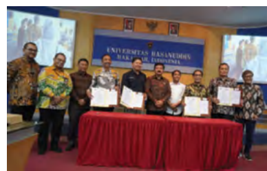
17 Maret 2023 | March 17, 2023

On March 17, 2023, at Hasanuddin University (UNHAS), a memorandum of understanding was signed between the Minister of Agrarian and Spatial Planning/National Land Agency (ATR/BPN) and the Director of PTPN XIV regarding the settlement of land dispute conflicts in Keera District, Wajo Regency. This memorandum of understanding reaffirms the commitment of both parties to seek fair and sustainable solutions in resolving land disputes involving the local community.