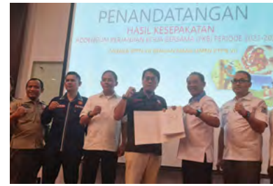
18 Oktober 2023 | October 18, 2023

PTPN VII and the Labor Union of Perkebunan Nusantara (SPPN) VII signed an Addendum to the Collective Labor Agreement (CLA) of PTPN VII for the period of 2022-2023 in Bandung on Tuesday, October 18, 2023. Prior to the signing, negotiation teams from both parties had discussed the draft materials of the CLA Addendum, focusing on the implementation and adjustment of the grading system from the previous rank-based system. This step signifies a joint commitment to enhancing efficiency and fairness in human resource management, as well as strengthening harmonious industrial relations.