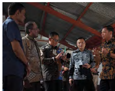
2 Oktober 2023 | October 2, 2023

On October 2, 2023, at the Banaran Coffee Mill of PTPN IX, the Nusantara Coffee Summit was held as part of the Malioboro Coffee Night. This event serves as a platform for meetings between coffee producers and consumers to explore broader collaboration opportunities. A total of 20 people attended the event, including representatives from the Nusantara Coffee PMO. The presence of representatives from the Nusantara Coffee PMO at this event demonstrates support for joint initiatives to enhance the Indonesian coffee industry as a whole.