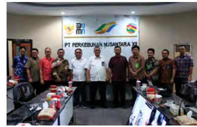
22 November 2023 | November 22, 2023

The event continued with a Closing meeting, where it was announced that PTPN XII successfully maintained its certification and transitioned to ISO 27001:2022.