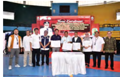
9 November 2023 | November 9, 2023

On November 9, 2023, at GOR Sudiang, the Governor of South Sulawesi, Bahtiar Baharuddin, and the Director of PTPN XIV signed a Memorandum of Understanding (MoU) for collaboration in the banana cultivation program. This collaboration aims to develop a banana cultivation program with a business scheme in the region. This step reflects a shared commitment to enhancing the agricultural sector, creating new economic opportunities, and strengthening cooperation in supporting regional economic growth.