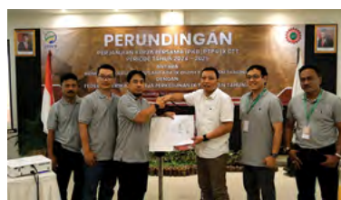
21 November 2023 | November 21, 2023

On November 21, 2023, at LPP Garden Yogyakarta, the signing and socialization of the Collective Labor Agreement between the Federation of Labour Unions of Perkebunan Nusantara (FSPBUN) and the Management of PTPN IX took place. The event was attended by around 25 representatives from FSPBUN and the management of PTPN IX. This step aims to improve comfortable working conditions and build harmonious industrial relations, enabling PTPN IX to continue improving the quality of its products.