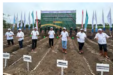
23-25 Januari 2023 | January 23-25, 2023

The visit began with a visit to P3GI Pasuruan, before proceeding to visit and conduct the inaugural planting at the Nyeoran estate in Lumajang.