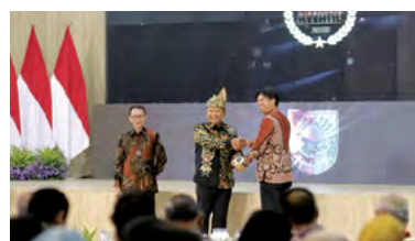
19 Desember 2023 | December 19, 2023

The Jember Tax Award 2023 is an event organized by the local government to appreciate taxpayers who are compliant and diligent.