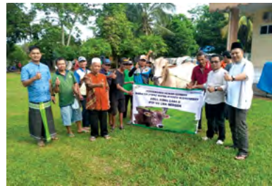
29 Juni 2023 | June 29, 2023

PTPN VII conducted animal sacrifice during Eid al-Adha 1445 Hijriah in Bandar Lampung. A total of 100 sacrificial animals, consisting of 50 cows and 50 goats, were slaughtered by PTPN VII from all existing work units. Apart from being a manifestation of devotion to Allah SWT, the sacrificial ritual also serves as a part of social worship aimed at fostering harmony within the workplace and strengthening solidarity among employees. This event reflects the Company's commitment to reinforcing religious and social values while nurturing a sense of togetherness in the work environment.