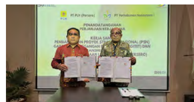
21 Desember 2023 | December 21, 2023

This collaboration was formalized with the signing of a cooperation agreement between PTPN I Regional 5 and PT PLN (Persero) UIP JBTB at the PTPN I Regional 5 office in Surabaya.