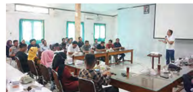
4 & 6 September 2023 | September 4 & 6, 2023

Pada tanggal 4 dan 6 September 2023, di Unit Kebun Siluwok, PTPN IX menyelenggarakan sosialisasi Penataan Sumber Daya Manusia (SDM) bagi karyawan. Acara ini bertujuan untuk meningkatkan keterampilan, pengetahuan, dan kemampuan karyawan dalam menghadapi perubahan industri di Kabupaten Batang. Bagian SDM bertanggung jawab atas pemetaan karyawan. Total 231 karyawan