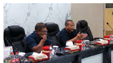
28 Desember 2023 | December 28, 2023

The meeting was conducted in a hybrid format at the Region 5 Office Meeting Room and via Zoom, attended by the entire Board of Regional Management of PTPN I, the RPN Team, and BCG Consultants.