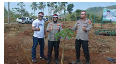
20 Agustus 2023 | August 20, 2023

Pada tanggal 20 Agustus 2023, di Unit Kebun Getas Kabupaten Semarang, PTPN IX mengadakan kegiatan penanaman pohon bersama Kepolisian sebagai bagian dari komitmen bisnis berkelanjutan sesuai prinsip ESG ( Environmental, Social, and Governance ) untuk meningkatkan kualitas hidup masyarakat. Acara ini dihadiri oleh 36 orang dan menjadi wujud nyata tanggung jawab sosial perusahaan dan kesadaran akan pentingnya pelestarian lingkungan. Melalui kolaborasi dengan Kepolisian, PTPN IX menunjukkan komitmen dalam menjaga keberlanjutan lingkungan sekitar.